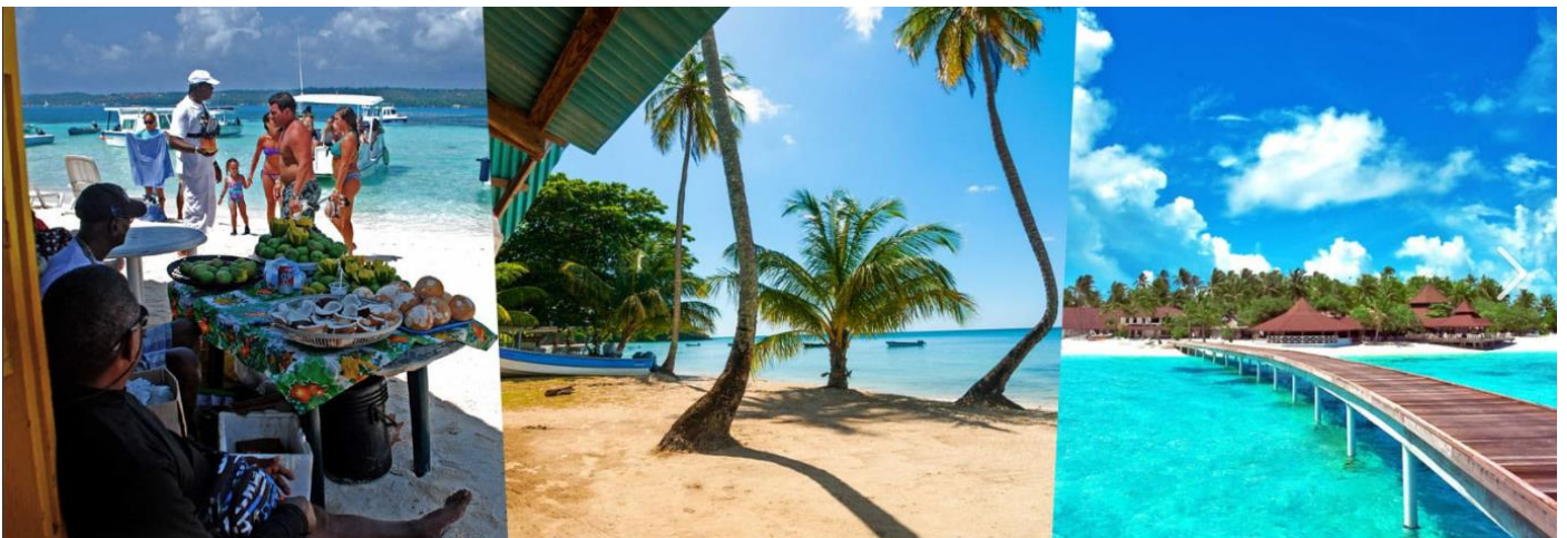
Isla de Providencia e Isla Santa Catalina